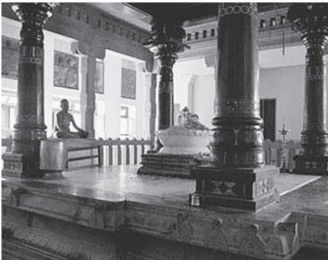
Starea de Mahasamadhi 1 a Maestrului